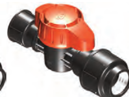
Cuerpo 1", 1" Rosca Hembra Compresión 32 mm