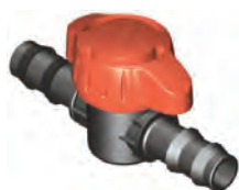
Espiga 16 mm

Doble Espiga, Tubería de PE y PVC, Conexión para Manguera Plana y Cinta