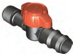
Rosca Macho 1/2" Espiga 21 mm

Doble Espiga, Tubería de PE y PVC, Conexión Manguera Plana y Cinta