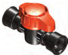
Cuerpo 1" Rosca Hembra 1" (Tuerca Libre)