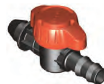
Derivación con Goma Espiga 16 mm