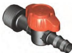
Rosca Macho 3/4" Espiga 16 mm