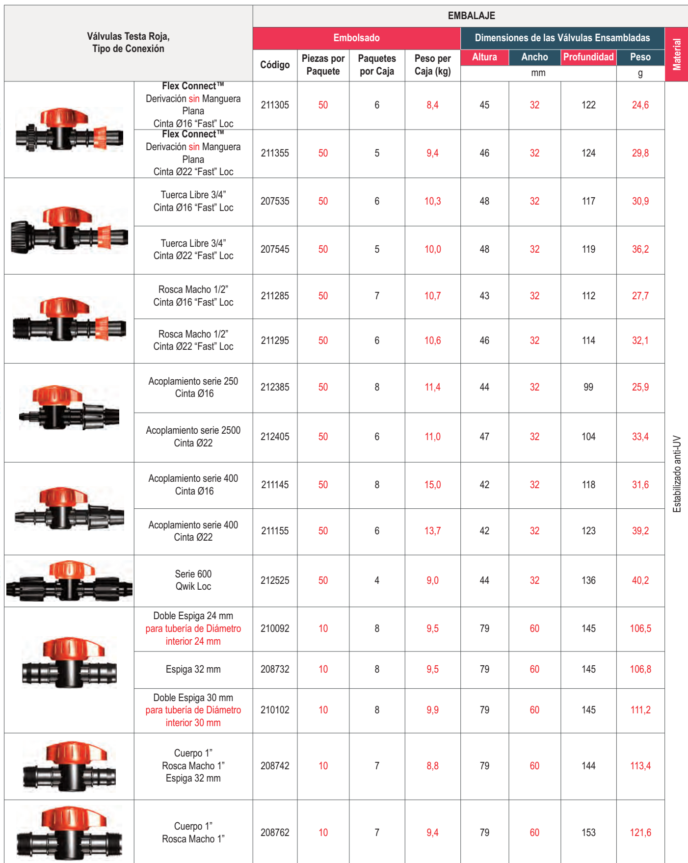
Cuerpo 1", Rosca Hembra 1" (Tuerca Libre) Espiga 32 mm