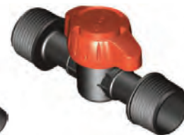
Rosca Macho 3/4"