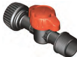
Tuerca Libre 3/4" Rosca Macho 3/4"