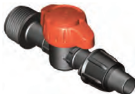
Rosca Macho 3/4" Cinta Ø16