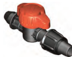
Derivación con Goma Cinta Ø16