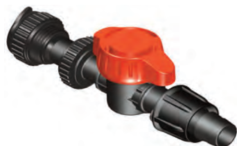
Flex Connect™ con Derivación para Manguera Plana Cinta Ø16