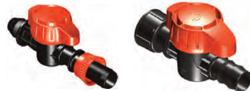
Derivación con Goma Cinta Ø16 "Fast" Loc