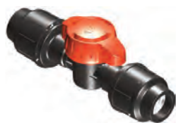
Cuerpo 3/4" Compresión 20 mm

Espiga, Rosca, Cinta , Tuerca Libre y Compresión