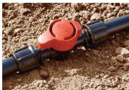
Cinta Ø16 "Fast Loc"