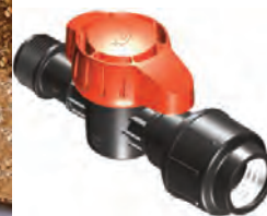
Cuerpo 1", Rosca Macho 1" Compresión 32 mm