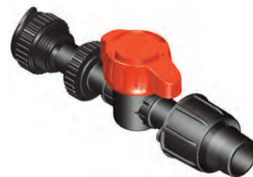
Flex Connect™ con Derivación para Manguera Plana Cinta Ø22