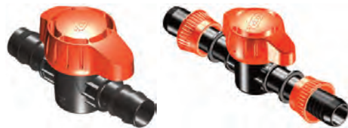
Cuerpo 1" Espiga 32 mm

Espiga, Rosca, Cinta ,Tuerca Libre y "Fast" Loc