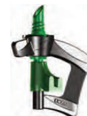
Invertido Boquilla Verde