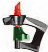
Invertido Boquilla Rojo