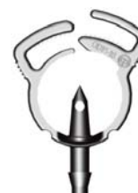
Micro Saddle Diamètre Extérieur de 16 à 18 avec Adaptateur auto-perçant et connexion 4,5 mm cannelé