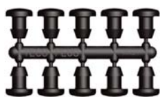
Bouchons de Riparation (10 pièces)