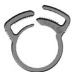
Cliquet de Serrage Diamètre Extérieure 16 - 18