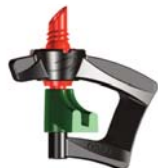
Invertito Ugello Rosso