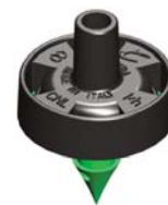
Mikra™ 8 l/h Innesto 4,5 mm