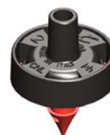
Mikra™ 2 l/h Innesto 4,5 mm