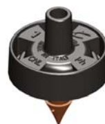
Mikra™ 1 l/h Innesto 4,5 mm