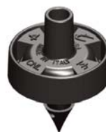
Mikra™ 4 l/h Innesto 4,5 mm